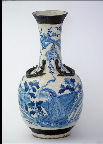
Chinesische Vase mit applizierten Drachen, Qing-Dynastie (1662–1722), blaues, florales Dekor, Porzellan, Privatbesitz