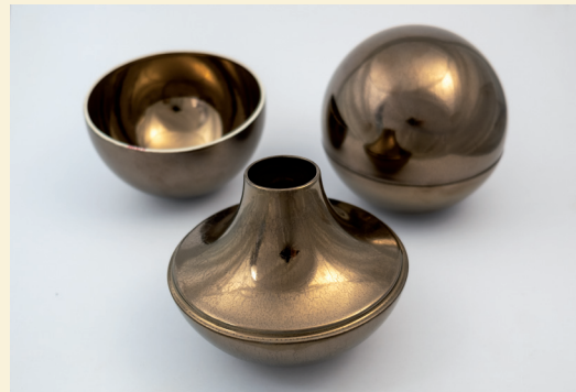
Vasen mit Deckel, Design: Franco Bucci, Steingut, Mettlach, 1973, Villeroy & Boch, Abteilung Unternehmenshistorie

Die neue Sonderausstellung »Über den Tellerrand hinaus – Gefäße« präsentiert eine einzigartige Auswahl aus der langen Geschichte der Keramik, von den Kelten bis in