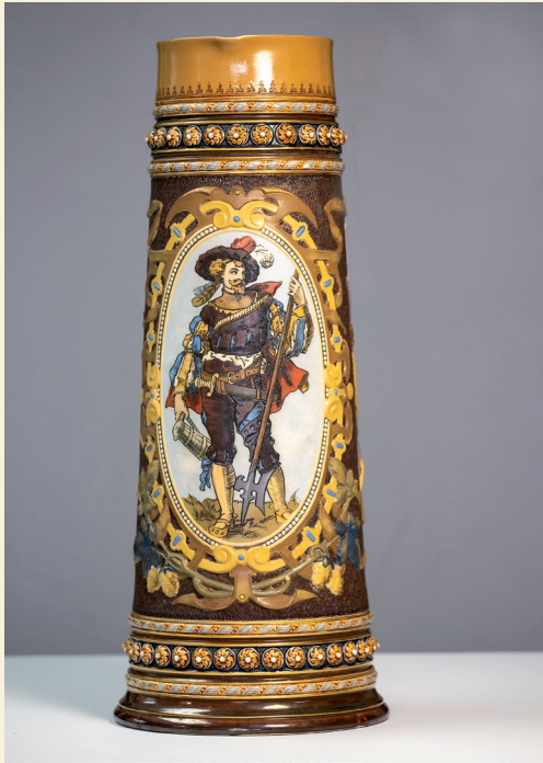
Christian Warth: Kanne ohne Deckel mit Dekor eines Landknechts mit Lanze und Krug, Chromolithografie, zweite Hälfte 19. Jahrhunderts, Kreisverwaltung Birkenfeld

die Moderne. Jedes der zu sehenden Gefäße zeigt seine individuellen Besonderheiten in Form, Dekor und Farbe.