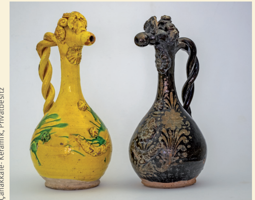
Zwei Kannen, osmanisch, spätes 19. Jh., Çanakkale - Keramik, Privatbesitz

Die Ausstellung wurde von Studierenden der Kunstgeschichte der Universität Trier kuratiert und kann vom 21. April bis zum 31. Dezember 2024 besucht werden.