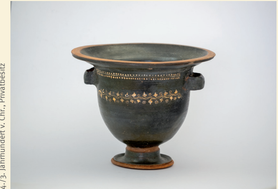
Apulische Keramik (Glockenkrater), 4./3. Jahrhundert v. Chr., Privatbesitz

Lassen Sie sich faszinieren, wie vielfältig, bunt und frei Vasen und ihre Verwandten sein können.